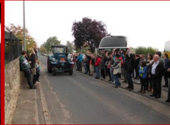
Am nächsten Tag fahren wir