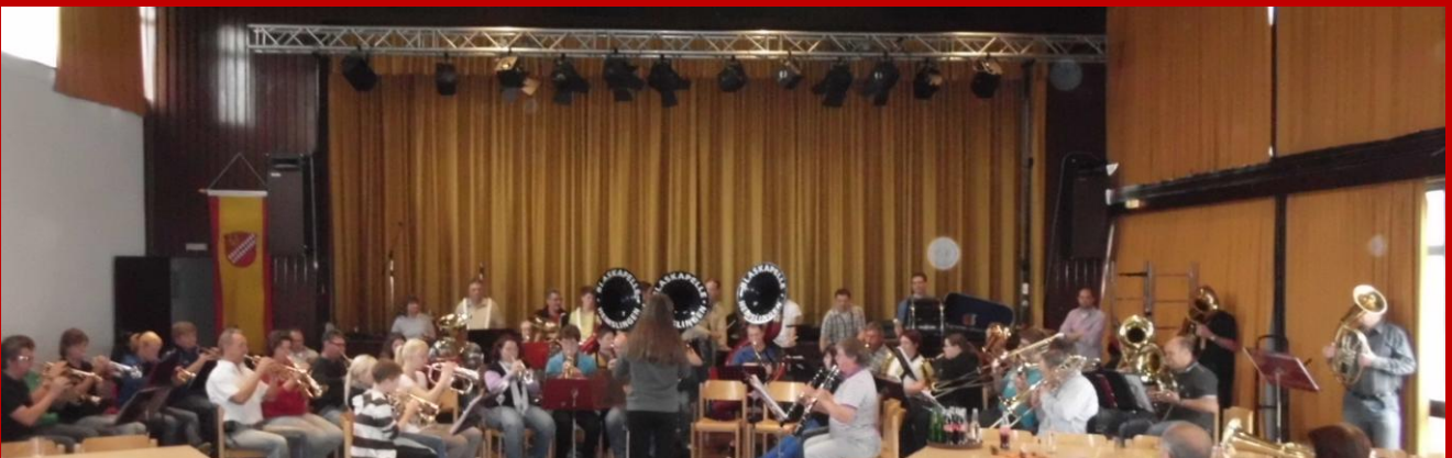
50 Musiker boten zum Abschluss ein mehrstündiges Konzert, abwechselnd aus dem Repertoire beider Vereine.

Vom 19.- 21.10.2012 trafen sich die Musikvereine MC Bickenbach und BK Hemslingen. Diese Freundschaft wird seit rd. 30 gepflegt und alle 2 Jahre neu bestätigt. So wie in den vielen Jahren zuvor, konnten wir auch dieses Mal feststellen, dass wir noch viele gemeinsame Treffen zu erwarten haben.