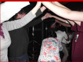
und noch viel geselliger.