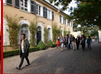
nach Oestrich- Winkel. Hier folgte ein Rundgang um die Wein-