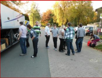
Haben wir alles verstaut?