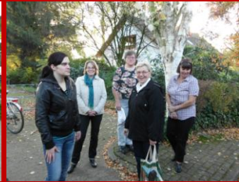
Es verreisen nur nette Leute.