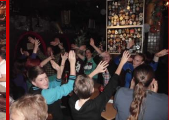
Unser gemütlicher Abend in Schors Weinstadt. Mit traditionellen Stimmungsliedern steigerte Schorsch die gute Laune.