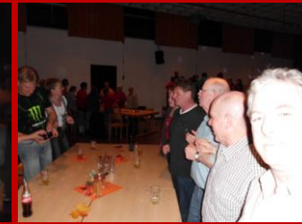
Es wurde geselliger...