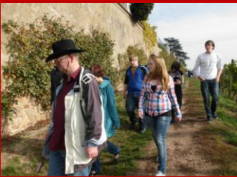
berge von Schloss Johannisberg auf dem 50. Breitengrad, sowie das Kloster Marienthal mit einem kleinen Sektempfang.