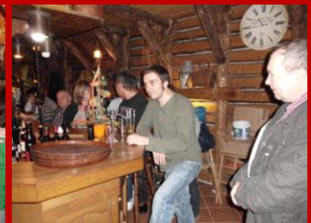
Die Bilder sprechen für sich. Einsamkeit und Langeweile waren nicht eingeladen.