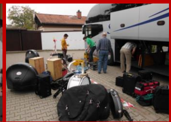
Das schönste gab es zum Schluss. Mit einem gemeinsamen musikalischen Frühschoppen beendeten wir die Begegnung.