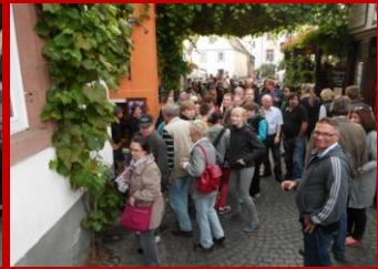
Abstecher in die Drosselgasse in Rudesheim. Die Gassen waren so eng, dass man teils nur als Karawane hindurch kam.