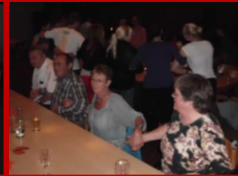
entspanntes Beisammen sein.