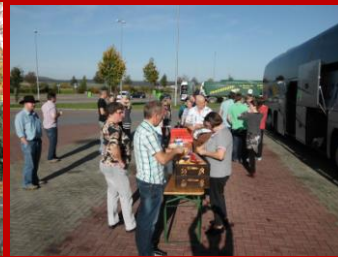
Zweites Frühstück unterwegs.