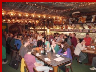
Danach zum Mittagstisch in