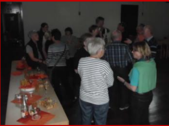
Abends dann ein geselliges,