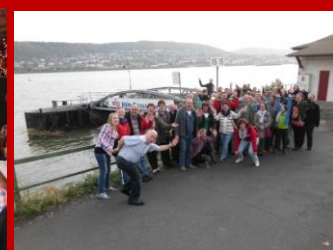
Zur Verdauung eine Dampferfahrt auf dem Vater Rhein.