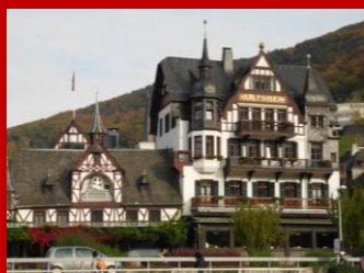
Zu sehen sind hier einige