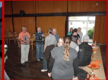
Begrüßung in Bickenbach.