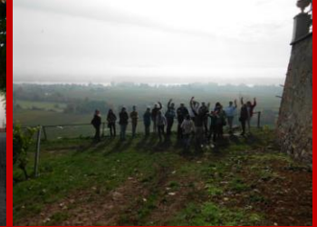
berge von Schloss Johannisberg auf dem 50. Breitengrad, sowie das Kloster Marienthal mit einem kleinen Sektempfang.