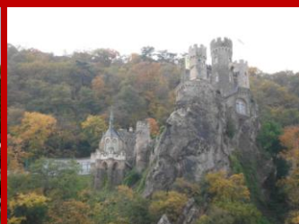
links und rechts des Rheines.