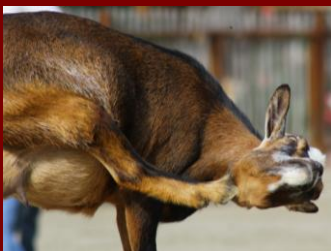
Na, wo juckt es?