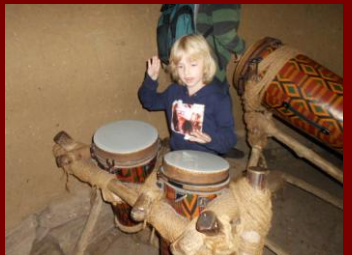
Oh, hier gibt es Musik.