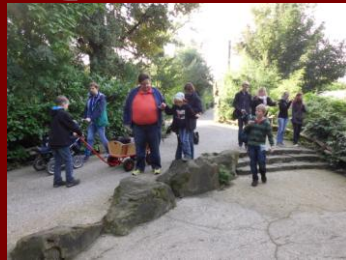
Erst einmal rein in den Zoo.