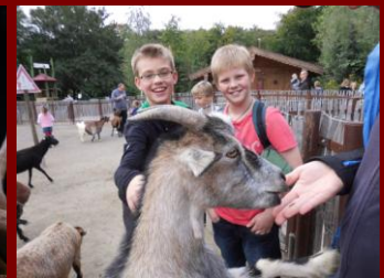
Wer traut sich zu füttern?