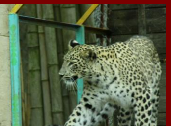
Schnell noch eine „Gepard“ Grußkarte an Mama.