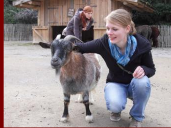
(Die Ziege) Und so fotogen....eine Freundschaft...