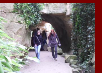
Der Tag ist vorbei...