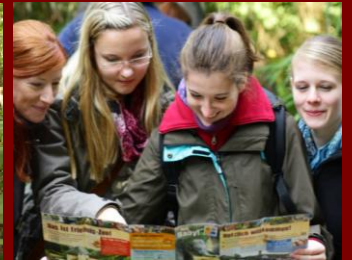
Aber wo müssen wir lang?