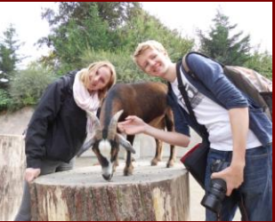
... fürs Leben?