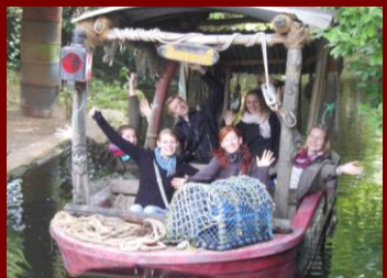
Eine Bootsfahrt die ist ...