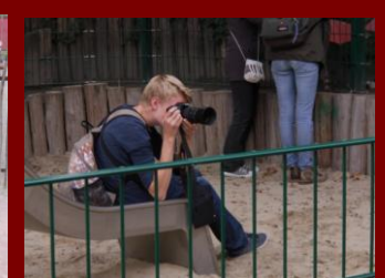
Hier der Experte.