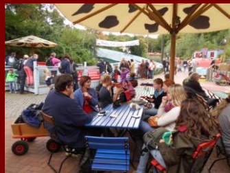
Und hier endlich Pause...