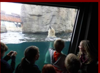
Schau mal, Eisenbären!