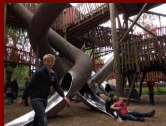
Die noch nicht.