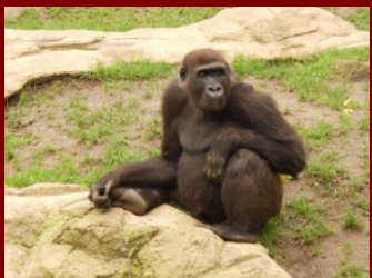
...so sehen sie aus.