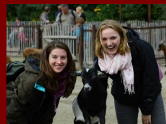
... muss was aushalten.