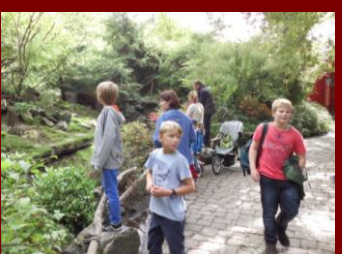
Dem Rundweg folgend.