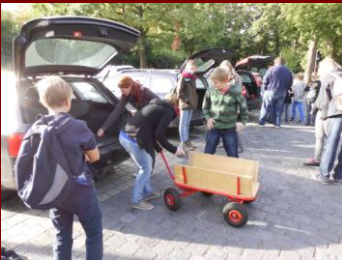
Nun geht dat los.