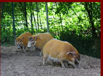
Schweine, oder was?