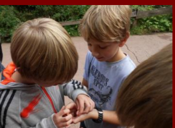
Ein Frosch, ...zeig mal!