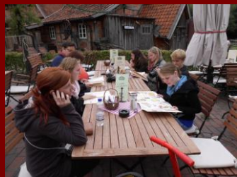
Die hier sind fertig.