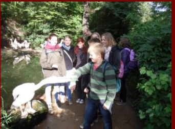
Wer traut sich?