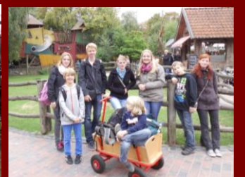
Gruppenfotos werden kleiner.