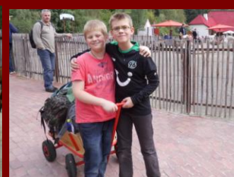
Zwei, die sich verstehen.