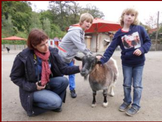
Ist sie nicht niedlich?