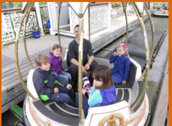
Gondel fahren macht ...