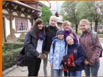
Diese beiden Gruppen ....