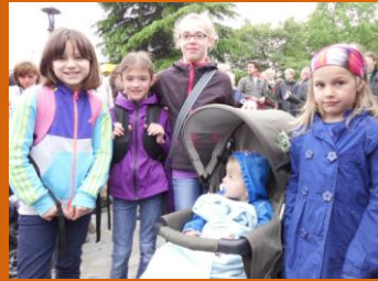
hatten sich schnell gefunden.