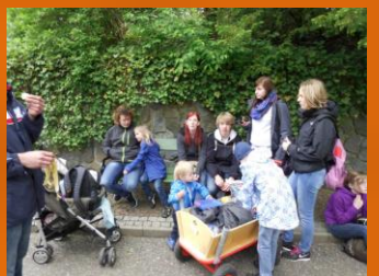
Die erste verdiente Pause.