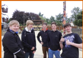
Hier überlegt „Mann“ noch!