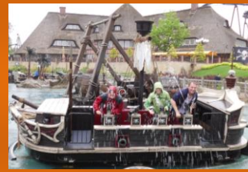
Und hier unsere „kleinsten“.