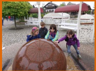
Wir bringen das ins rollen.