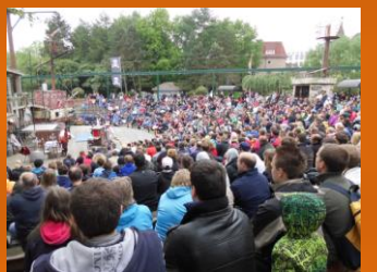
Piraten auf der Freilichtbühne.