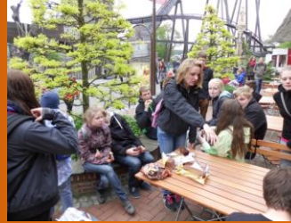
Die ersten sind...