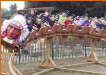
Die ersten ...