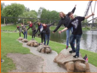
Sind wir nicht reif für DSDS?