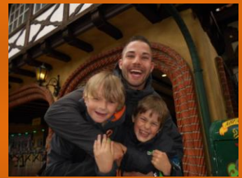
Hier wird es noch geklärt!