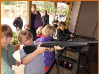
Trainingslager für Kinderkönige.