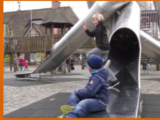
werden einfach ....