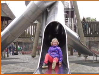
Unsere jüngsten ...